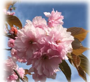
にわ山のソメイヨシノ