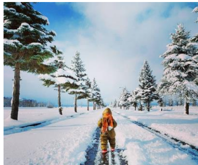
『クリスマスツリーがいっぱい』