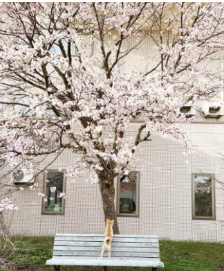
『なにこれ? 《初めて見る桜》』