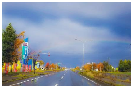
『奈井江の空に見る虹』