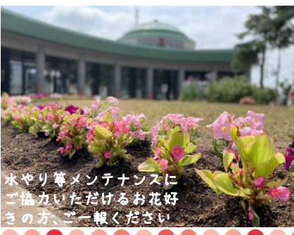
水やり等メンテナンスに ご協力いただけるお花好 きの方、ご一報ください