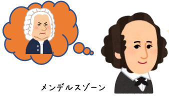
メンデルスゾーン

バッハ大先生の音楽はスバラシイ～ でもみんなに認められないうちに この世を去った～ なので私が復活させて世に広める～