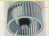
こんなのを洗いません