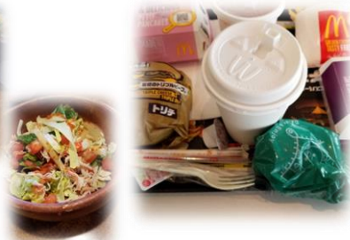
ファストフードが やめられません マックのトリプル チーズバーガー サイドは必ず ナゲットです