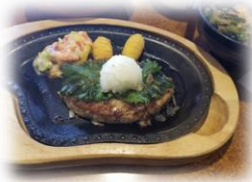
ビックリドンキーの 定食おろしそハンバーグ です サラダを付けました