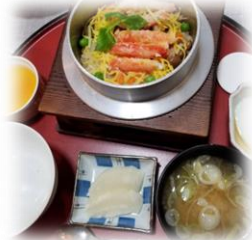
全品制覇を目指してます 奈井江町「ままや」