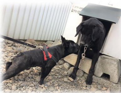
冬奈の「奈」は もちろん奈井江の「奈」 さすがです!

タムは迷子さん。 良いご家族に拾って もらいました。 こんな大きな体で 誰よりもシャイボーイ。