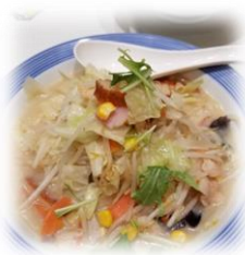
人生初の長崎チャンポン リンガーハット イオン旭川西店内