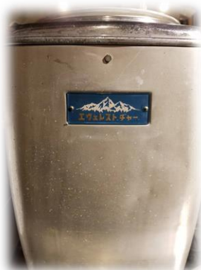
↑エヴェレストジャージャーなので 保温機能付きなのです