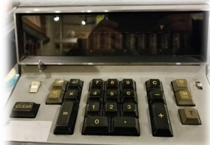
↑ソニー社初期の電卓！ 高かったんですよ