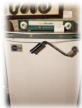
←ゼネラル社製洗濯機 当時は電気洗濯機と言っていましたね