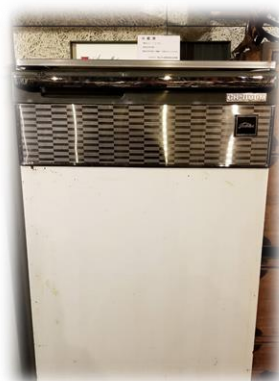
↑昭和40年製 東芝の冷蔵庫