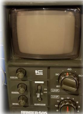
携帯用白黒テレビ→ ナショナルレンジャー 昭和50年 まだ使ってる人もいるのでは？